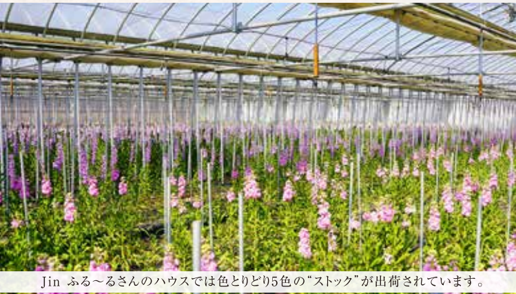
Jin ふる～るさんのハウスでは色とりどり5色の“ストック”が出荷されています。