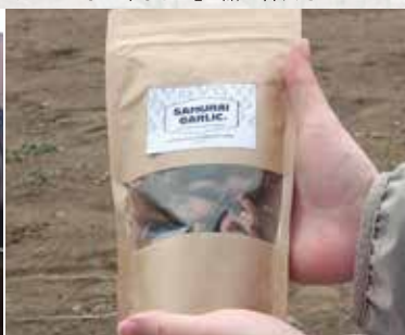
“馬の堆肥”を使って育てた『サムライガーリック』は濃厚な味わいが特長