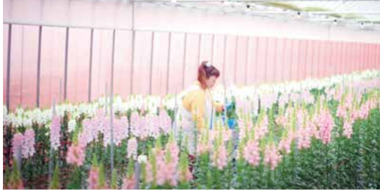
トルコギキョウ含め、初年度出荷した花は市場で高い評価を受けました

浪江町の花作りは、これからどんな未来を見せてくれるのでしょう。 「なみえ花通信」では、花のニュースはもちろん、浪江町の新しい農業 における明るいニュースもお届けしていきます。