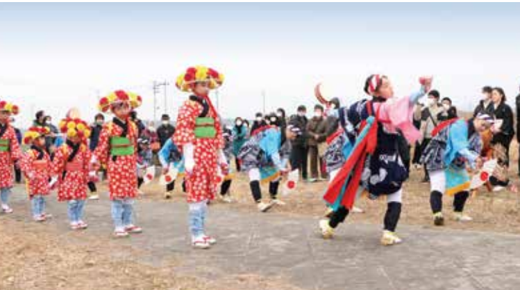
約三百年の歴史を持つ「安波祭(あんばまつり)」では「田植え踊り」が奉納されました